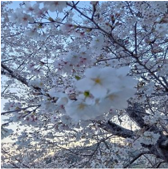
姫路信用金庫の前の満開の桜です❁