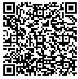
(電子申請フォーム)