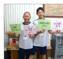
会議室の表示板を製作