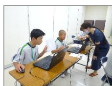
パソコン教室受講