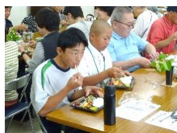
ふれあい給食で高齢者と