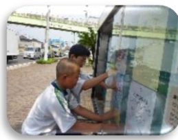
掲示物の張り替え