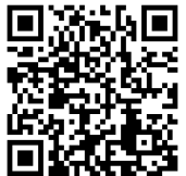
姫路市オンライン手続ポータルサイト