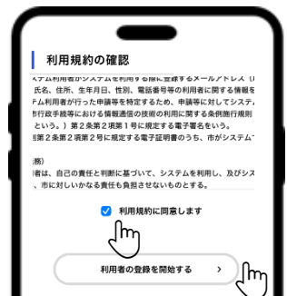
④ 「利用規約に同意します」にチェック ⑤ 「利用者の登録を開始する」を押す