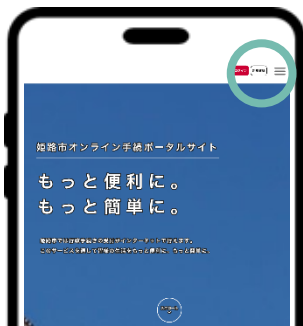
① 右上の「新規登録」を押す