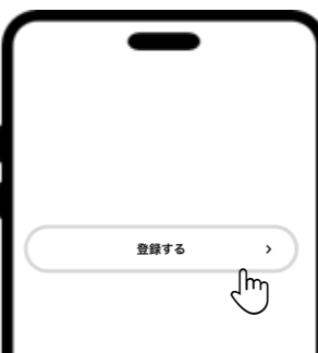
⑫ 入力間違いがないか確認し、「登録する」を押す