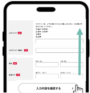
⑩ パスワードを設定し、氏名、住所などを入力 ⑪ 下にスクロールし、「入力内容を確認する」を押す