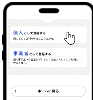
③ 「個人として登録する」を押す