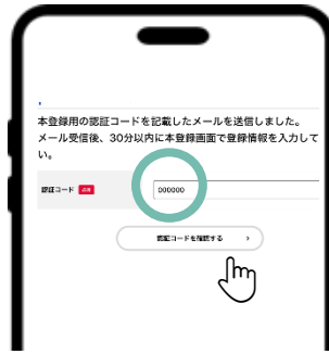
⑧ 画面に戻り、6桁の「認証コード」を入力 ⑨ 「認証コードを確認する」を押す