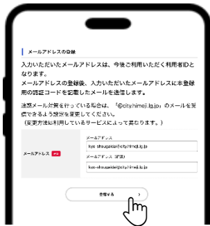
⑥ メールアドレスを2回入力し、「登録する」を押す