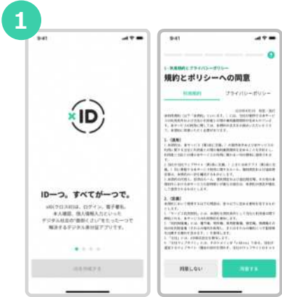
「xID」アプリをダウンロードしてアプリを開きます。規約とポリシーの確認をします。