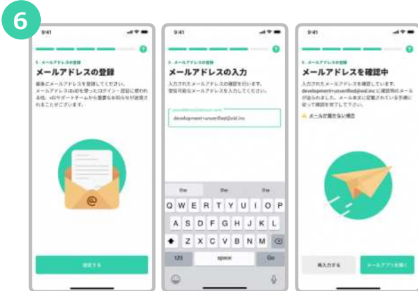
xIDからのメールを受信できるメールアドレスを入力します。