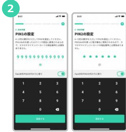
xIDアプリのログインや認証で使うPIN 1、電子署名で使うPIN 2を設定します。