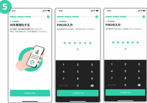
IDを有効化するために、PIN 1 とPIN 2 を再度入力します。