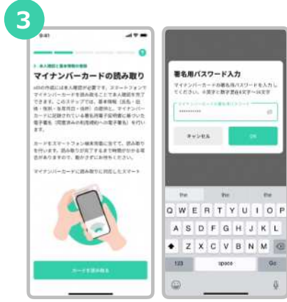
マイナンバーカード受取り時に設定した署名用電子証明書の暗証番号を入力します。 (英字大文字と数字混在の6~16桁)