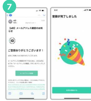
確認用メールに記載されているURLをタップした後、“利用を開始する”をタップします。