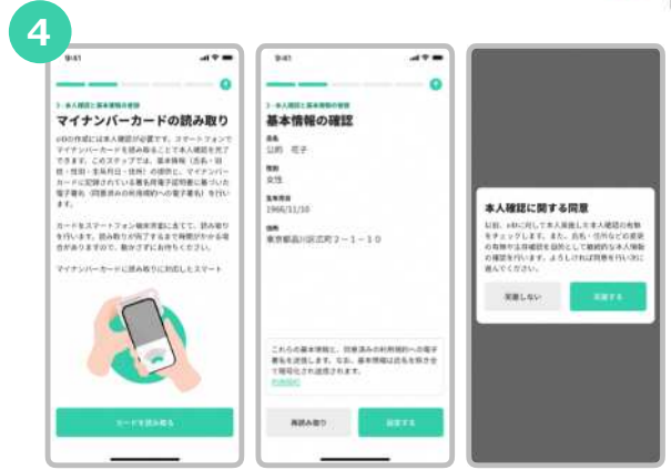
“カードを読み取る”をタップし、スマートフォンでマイナンバーカードの読み取りをします。読み取った情報を確認します。