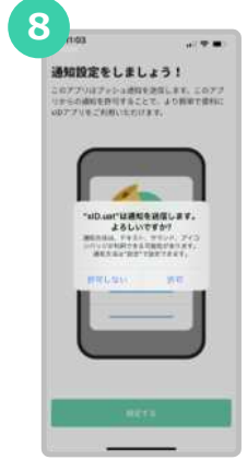
xIDをプッシュ通知でお知らせするために“許可”を選択します。