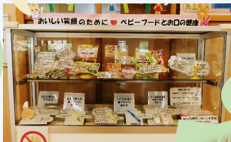
ベビーフードとお口の健康用品