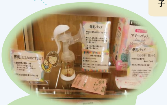
手動搾乳器や母乳パッドなど授乳ケアグッズ

姫路市と株式会社スギ薬局は、地方創生に関する包括連携協定を締結しました。スギ薬局から提供いただいた子育ての便利グッズを紹介しています。