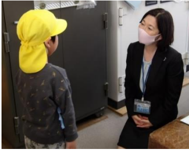
㉑「校長先生への自己紹介」