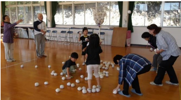
「老人クラブと玉入れ」