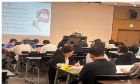
「視点から見た保育の振り返り」