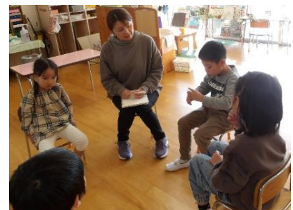
「クリスマス音楽会の話し合い」

(イ) クリスマス音楽会というテーマでの対話では、「楽しくしたい」「お家の人に見てもらいたい」等、活発に意見が出て、話し合うことの楽しさを実感できた。