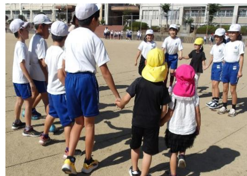
「仲よし班活動（はないちもんめ）」

それらの活動を通して、多くの人々と関わり、親しみや尊敬、憧れ等の気持ちを持ち、人と関わる喜びや楽しさを感じられるようになった。自ら関わろうとする姿に変わっていった。