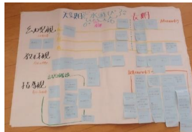
「付箋を使った自己の振り返り」