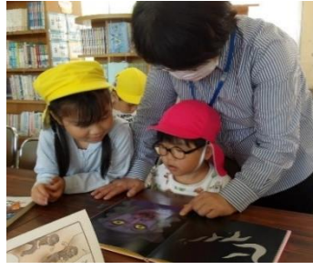
㉒「学校司書の先生の 絵本読み聞かせ」