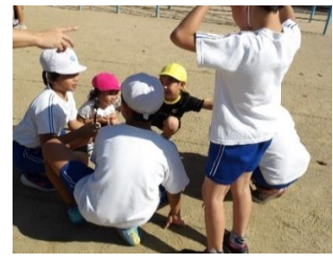
㉓「なかよし班活動での 遊びの相談」

(ウ)ア、イの体験を重ねる中で、学級内でも対話する活動を増やした。このことで、相手に分かるように伝えようと自分の発する言葉を意識する姿が見られるようになった。また、伝わらない時は言葉を言い換えようとする姿も見られるようになった。