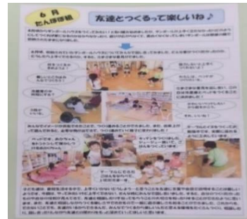
「友達とつくるって楽しいね」(※5)

6月 5歳児のダンボールハウスづくりのドキュメンテーションを教師がつくり、園内や小学校に掲示する。