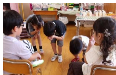
「火災時の避難方法の伝達」

(ア)混合学級において園生活の場を共にすることにより、相互関係に必然が起き、５歳児が４歳児には、言葉だけでなく身振り手振りを交えることでより伝わりやすくなることに気付いた。