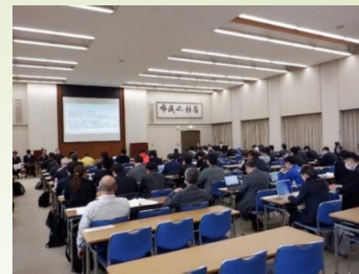
企業向け説明会の様子