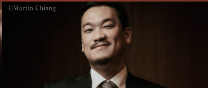
カウンターテナー 中嶋俊晴