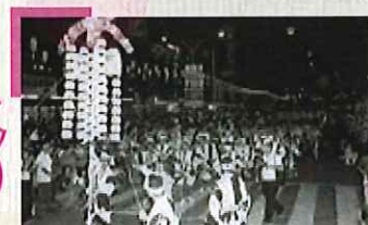
大手前通りをいっぱいに使ってのパレード。