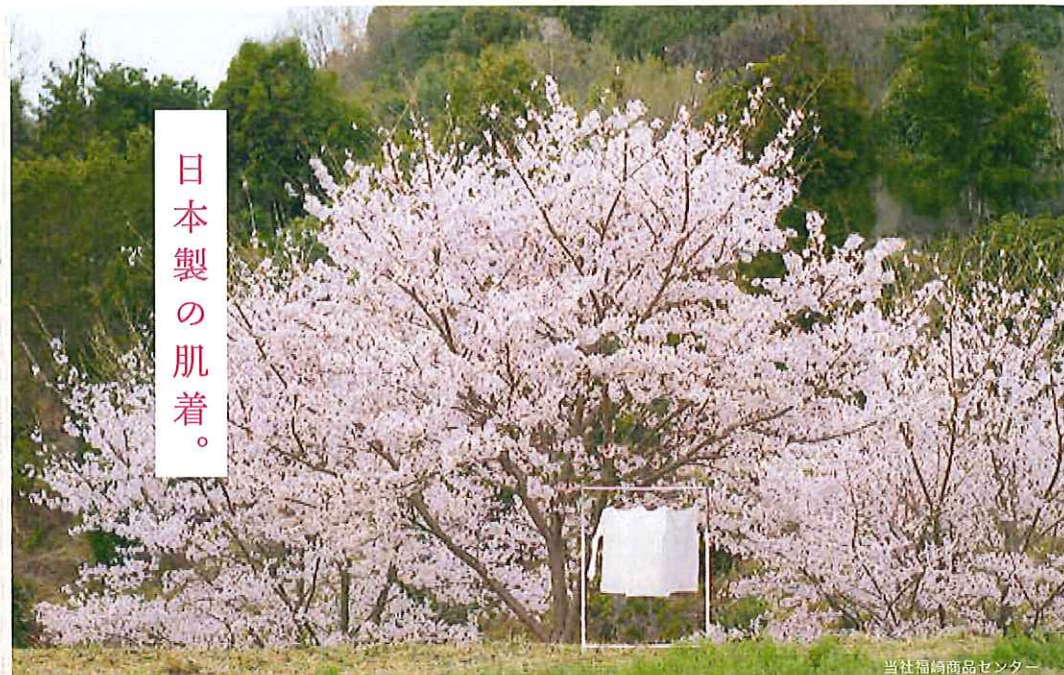
当社福崎商品センター