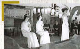
お城の女王発表会。緊張の様子が伺えます。