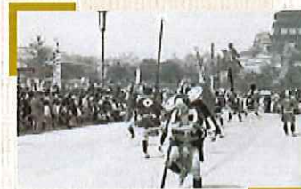
昭和の大改修中の姫路城前での毛槍拵箱演技。