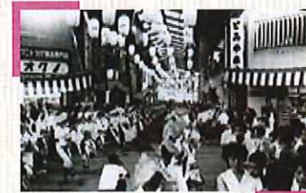
商店街でも盛大に歌い、踊っています。

姫路観光ナビ ひめのみち https://www.himeji-kanko.jp