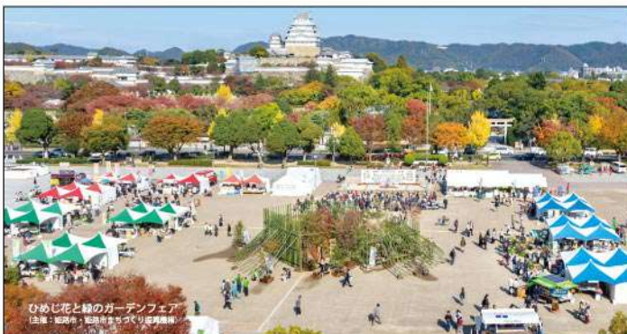
ひめじ花と緑のガーデンフェア (主催：姫路市、姫路市まちづくり振興機構)