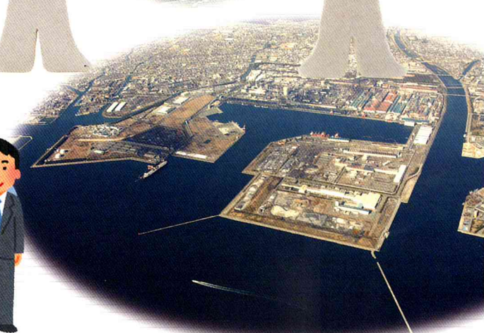
姫路市 播磨臨海工業地帯