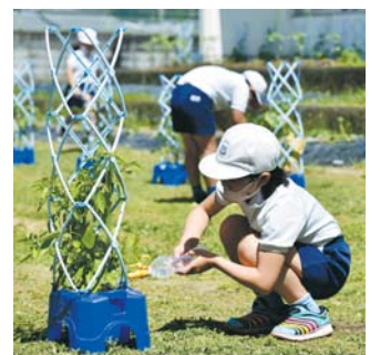
(再利用のペットボトルで水やり)