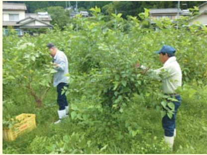
(桑の葉収穫の様子)

また、榊香寺ハーブ・ガーデンが廃園となった旧山之内幼稚園を姫路市から借り上げ、農家レストラン「且緩々」