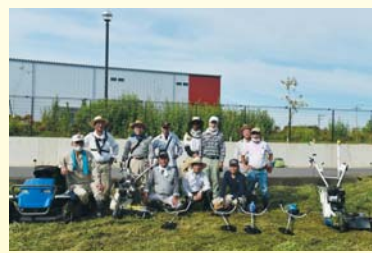
(上原田地区の消防援助隊)

類(乗用草刈り機、動力草刈り機、刈払い草刈り機)を無償貸与し、尚且つ年間活動費の助成をしています。年間処理面積は約4ヘクタールにも及びますが、草刈り対価は同隊発足以降継続して10円/mと安価に設定されているため、地域の地権者には非常に喜ばれています。将来にわたり、「消防援助隊」が存続できるよう、また、当地区の遊休農地の解消を図り、良好な農地の維持につながるよう、今後も地域一体となって取り組みを進めてまいります。