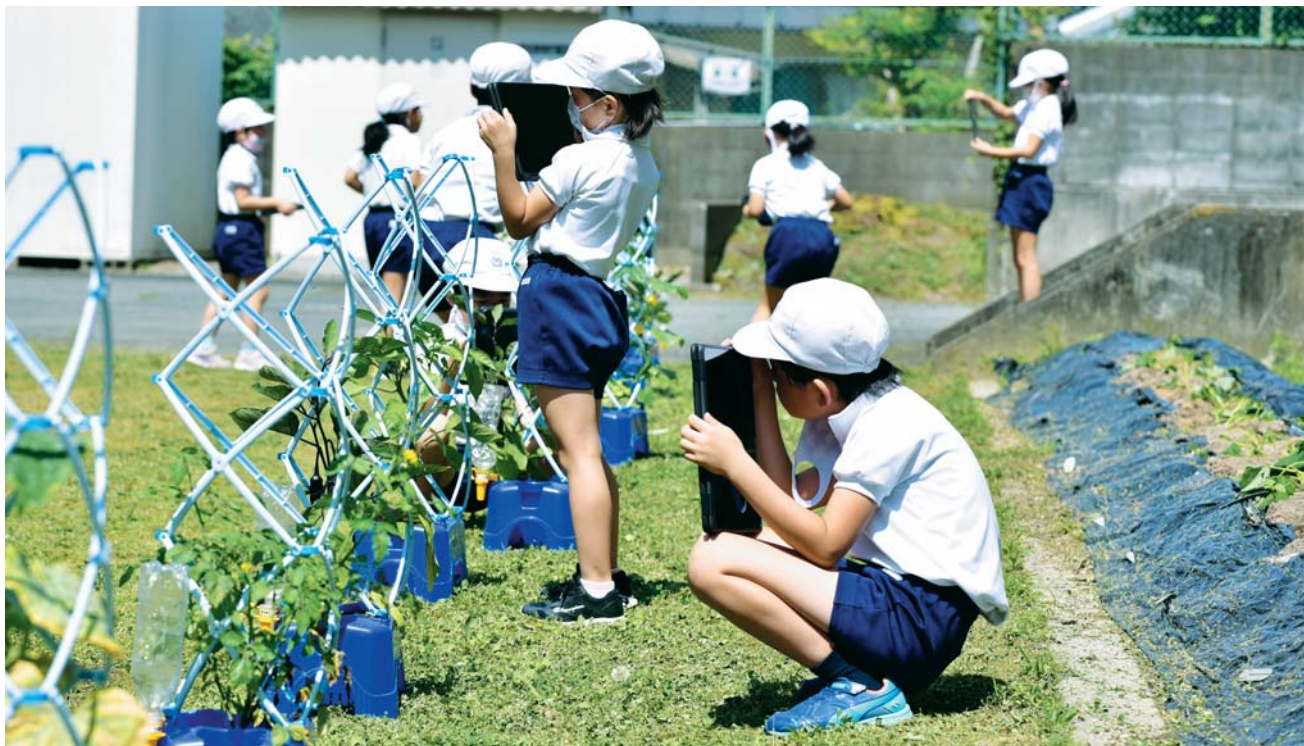
タブレットで野菜の成長記録をつける前之庄小学校2年生児童（夢前町前之庄）