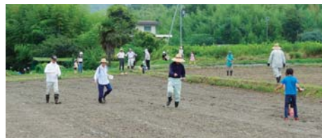
コスモスの種まき