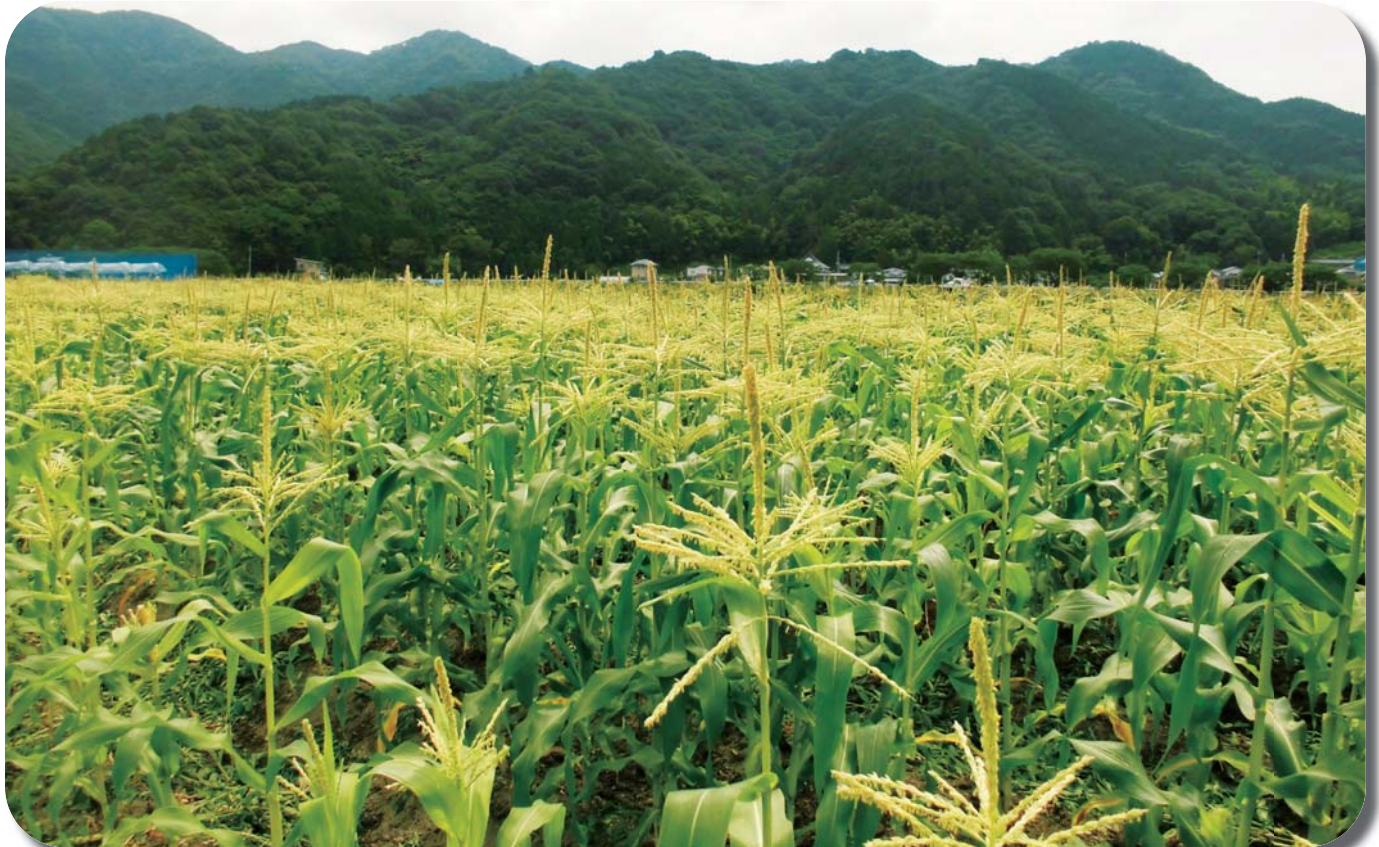
ゆめさきトウモロコシ