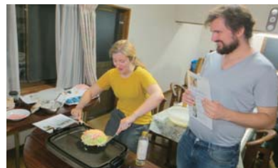
お好み焼き作りを楽しむゲスト