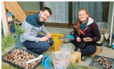
じゃがいもの収穫体験をするゲスト

紹介しています。始めてみて驚いたのですが、ゲストのほとんどが外国人です。（つまりは、日本人には農業はあまり人気がないということ？）私の畑の茄子やトマト、キュウ