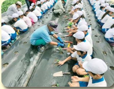
【大豆苗の植え付け】

姫路市中部に位置する荒川小学校では、3年生の児童が、連合自治会・農区・J A兵庫西・PTAの協力を得ながら、「大豆パワーにチャレンジ」と銘打って総合的な学習で大豆の種まきから豆腐作りまで一連の農業体験をしました。 6月下旬、「こんな小さな種で本当に育つのかな？」と不安と期待を胸に種をまきました。 7月初旬になり、苗を植えました。農区の方に教えて頂いたとおり、しっかりと土をかけ、愛情をこめて