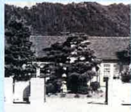
営農試験場 (昭和37年10月開設当時)

その後、昭和55年3月に現在地(山田町)に移転、翌年4月には「園芸センター」として、緑化の生産基地の役割を担ってきましたが、農業振興の拠点としての期待の高まりを受け、平成20年7月「農業振興センター」と改称しました。