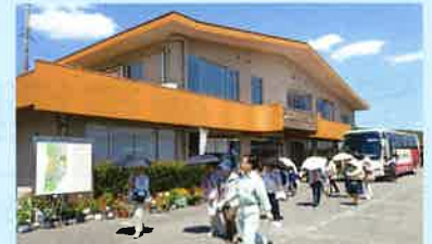
農業振興センター