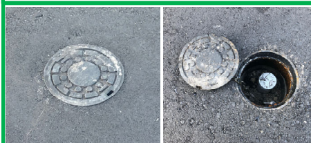
防護鉄蓋 防護鉄蓋内部