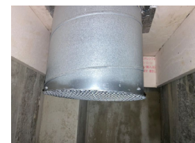
ピット換気 給気口