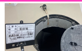
塗床仕上 密閉型マンホール スラブ厚200mm