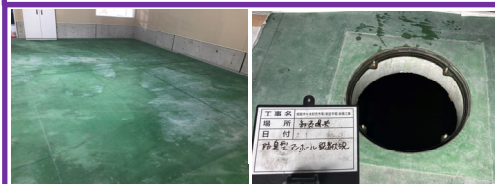
塗床仕上 密閉型マンホール スラブ厚200mm