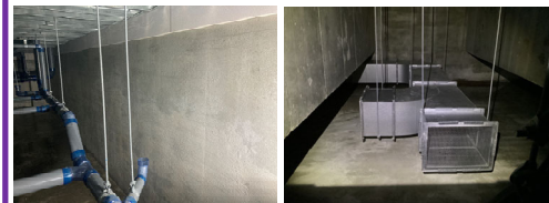
ピット防水 ピット換気 給気ダクト (写真にて確認)