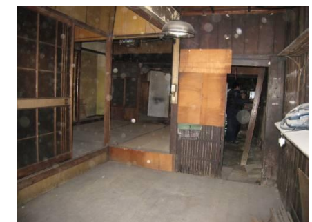
板間から土間方向