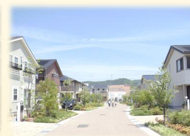
みどりゆた 緑豊かな落ち着いた雰囲気 の 住宅地