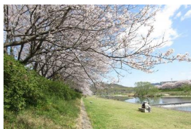
ゆめさきかわ 夢前川