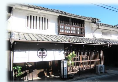
でんとうき たてもの ゆうこうかつよう 伝統的な建物の有効活用

けいかん し げん かつよう こうりゅう ば 景観資源を活用して交流できる場にし、 にぎわいをつくっていきます！