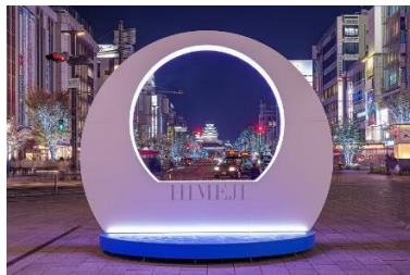
おおてまえとお やけい 大手前通りの夜景