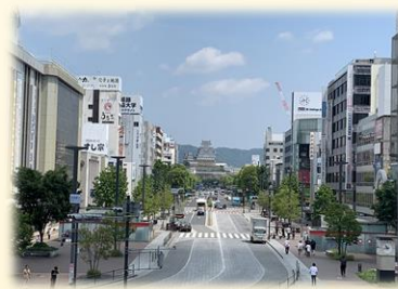
市のシンボルとなる ひめじえきしゅうへん おおてまへとお 姫路駅周辺と大手前通り

たてもの どうろ とき 建物や道路などをつくる時には、 まわ けいかん ちょうわ 周りの景観と調和するようにします！