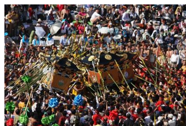
なだの けんか まつり 灘のけんか祭り