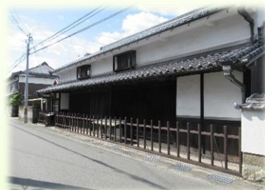
でんとうき なてもの まちな 伝統的な建物の町並み