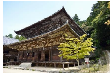
しょしやざんえんぎやうじ 書寫山圓教寺