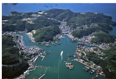
いえしましやとう 家島諸島