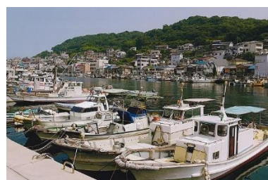
いえしまぎやう いえな 家島漁港と家並み