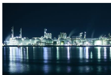
あぼし こうえん から み やけい 網干なぎさ公園から見た夜景