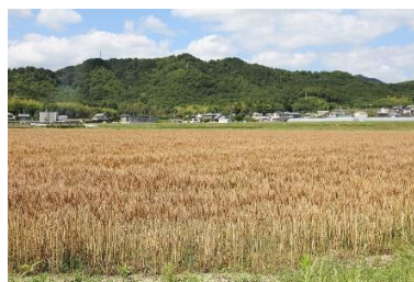
こうでら むぎばたけ 香寺の麦畑