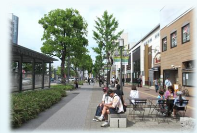
どうろ こうえん などの かつよう 道路や公園などの活用による にぎわいづくり