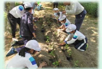
はな みどり う 緑を植える緑化活動

※景観資源とは、まちの魅力を高め、地域の特徴となるような重要な自然、歴史・文化、暮らし・営み、伝統、町並み、建築物・工作物、道路・公園・河川などをさします。