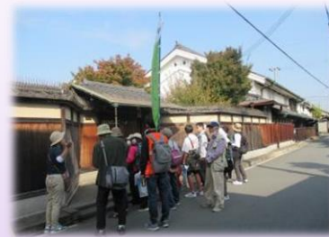
けいかん かつどう 景観まちづくり活動（まち歩きや出前講座など）

ある けいかん かつどう まち歩きなどのいろいろな景観まちづくり活動 ひと と く にたくさんの人と取り組みます！