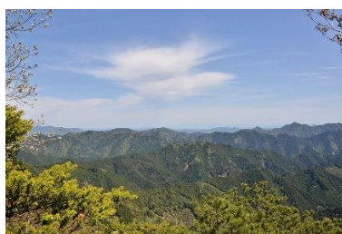
せつぴこさんちやうじやう み ふうけい 雪彦山頂上から見た風景