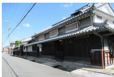
でんとうてき たてもの まちな 伝統的な建物の町並み