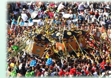
ちい き ぶんかてき まつ 地域の文化的なお祭り

ちい き けいかん し げん ほ お その地域にしかない景観資源を掘り起こし、 そだ 育てることで魅力を高めていきます！