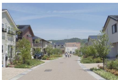
おちつ ぶんい き じゆうたくち 落ち着いた雰囲気の住宅地