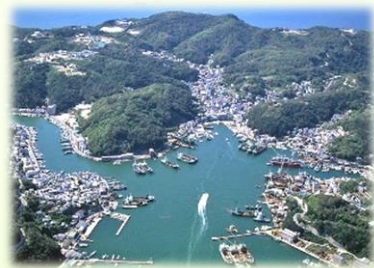
やま かわ うみ などの ゆた しぜん 山や川、海などの豊かな自然

ゆた しぜん れきしてき まちな まも 豊かな自然や歴史的な町並みなどを守ります！