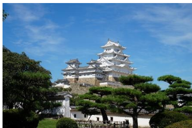
ひめじじょう 姫路城

ひめじし と し けいかんけいせいきほんけいかく こどもがくしゅうよう ～姫路市都市景観形成基本計画 こども学習用～