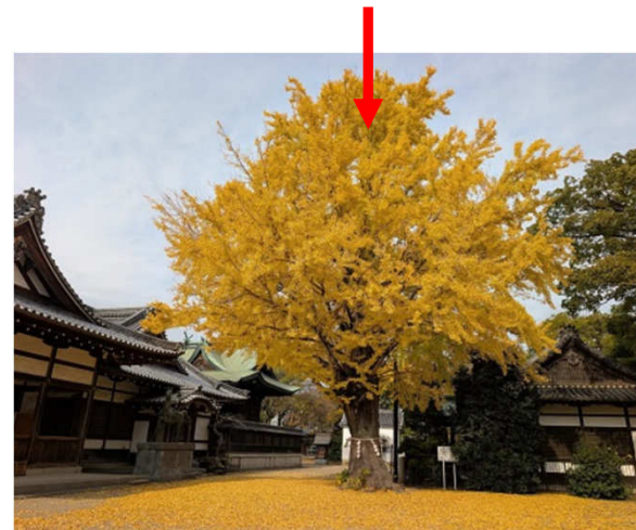
松原八幡神社のイチヨウ