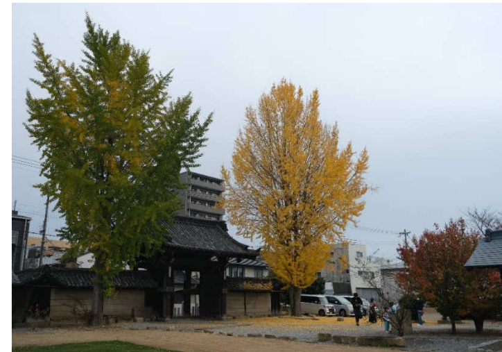
船場本徳寺のイチヨウ