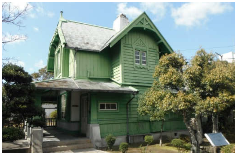
第2号 外国人技師住宅（旧図書館）