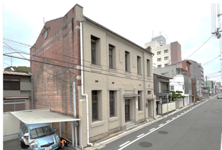
第46号 旧第三十四銀行（今井内科）