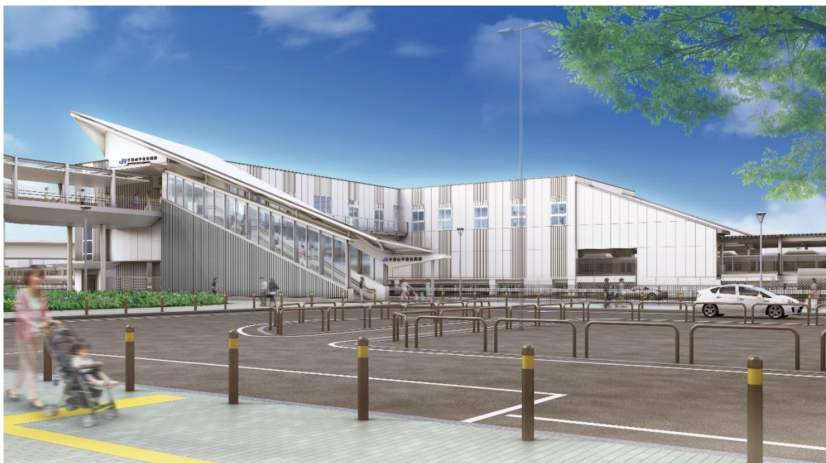
手柄山平和公園駅 完成イメージ（南側から）