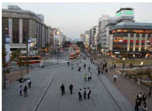
10月9日 JR姫路駅北口駅前広場

最後に、通行者の性別で見ると、全30地点のうち、8割以上の地点において男性より女性の通行量が多く、特に、二階町商店街では2倍以上(男性:1,999人、女性4,172人)の差が生じている。これは、当商店街で催されていた「ふれあい新鮮市」の来客の多くが女性であったことによるものと考えられる。