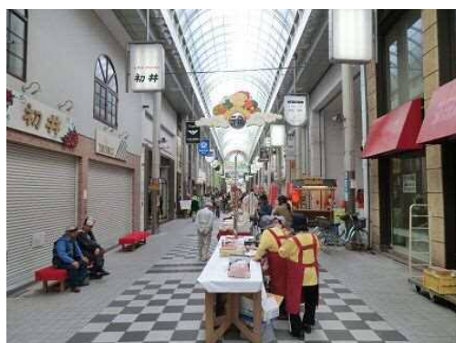
10月9日 二階町商店街