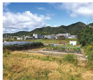
南東からの事業対象地