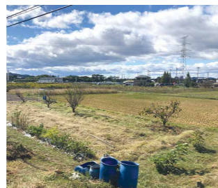
北東からの事業対象地