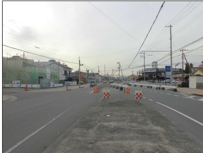
城北線(西工区) (東から西)整備中