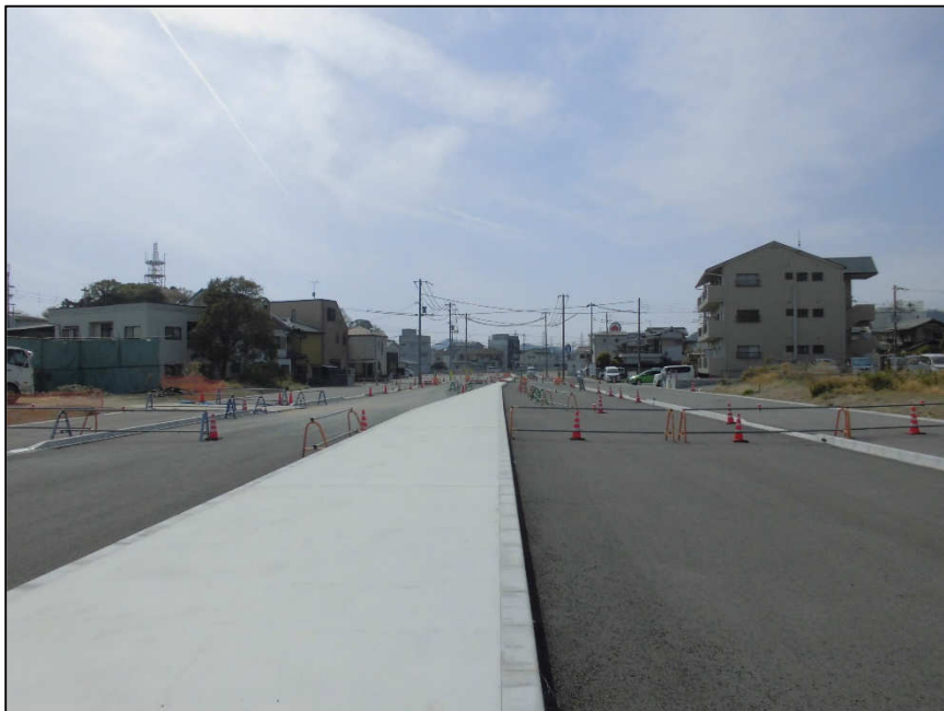
城北線(西工区) (東から西)整備中