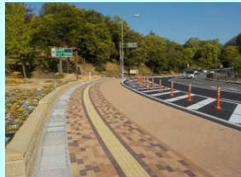
高質歩行空間整備