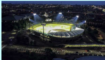
姫路球場ナイター照明等整備