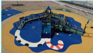
東エントランスゾーン(みんなのさくら広場)整備