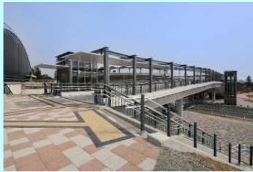
ペDESTリアンデッキ整備