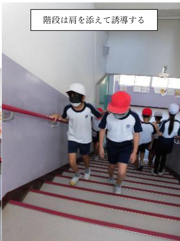
階段は肩を添えて誘導する