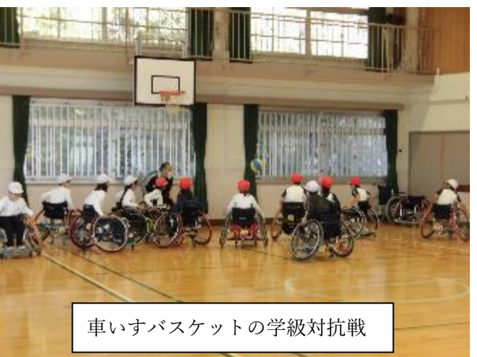
車いすバスケットの学級対抗戦