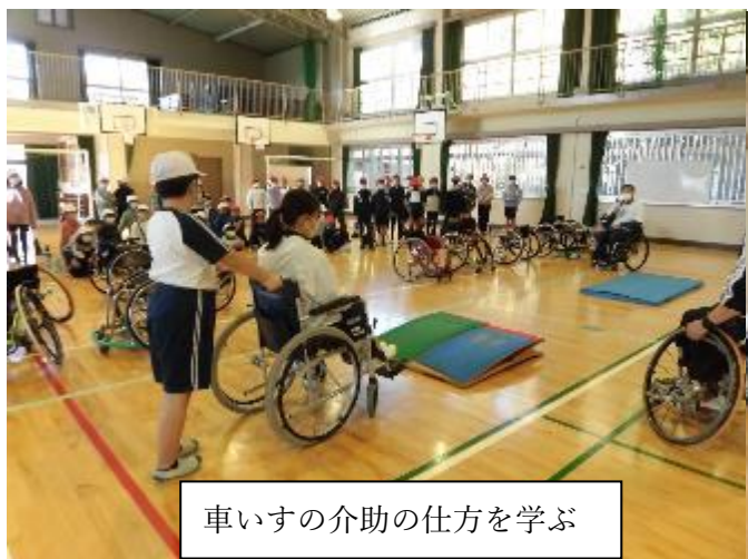
車いすの介助の仕方を学ぶ