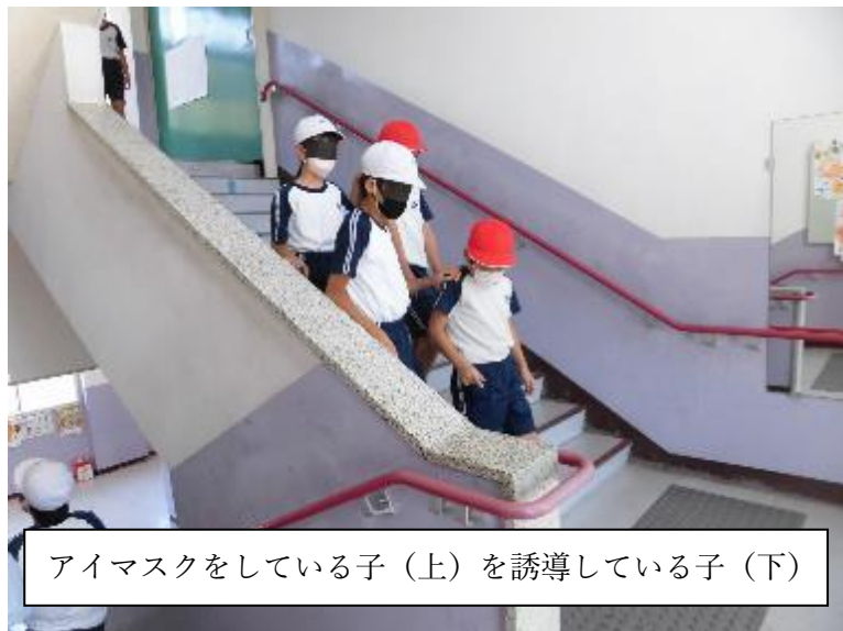
アイマスクをしている子（上）を誘導している子（下）