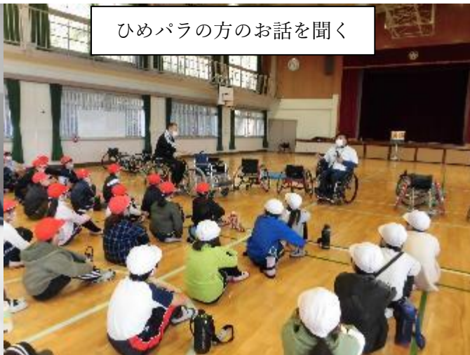
ひめバラの方のお話を聞く