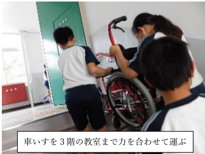
車いすを3階の教室まで力を合わせて運ぶ