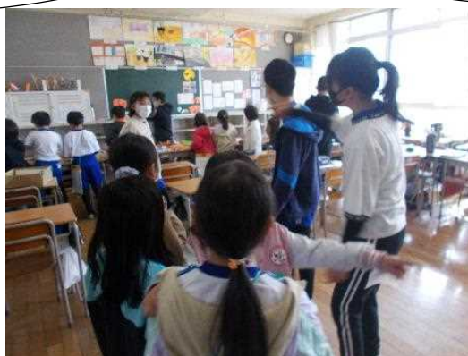
高学年の教室に様々な 学年の児童が集まる様子