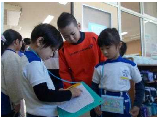
地図を確認したい1年生と 一緒に確認する6年生