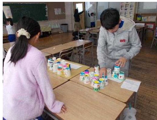
低学年の教室で ゲームをする高学年