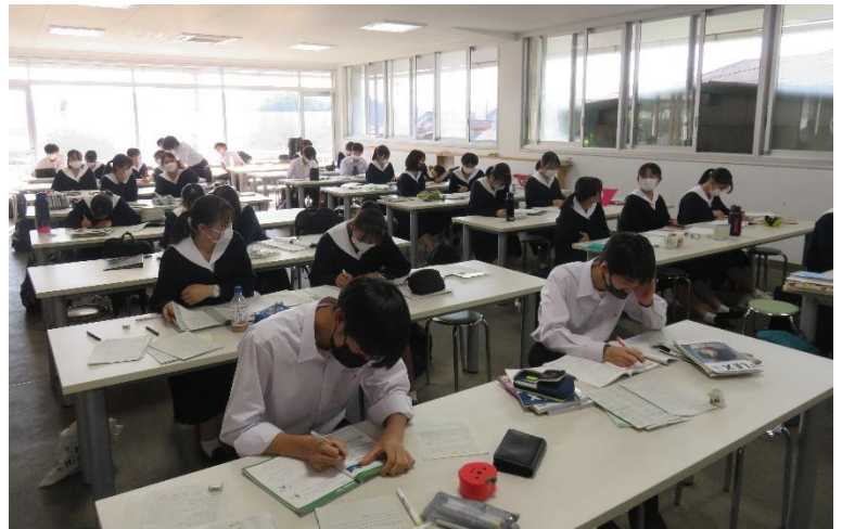
(渡り廊下や食堂での自習の風景)

また、姫高祭(文化祭)に向けてプログラムの表紙絵を作成するときにもタブレットを活用していました！生徒たちが自ら考えることで、どんな場面においてもタブレットが使えます！試行錯誤していこう。来る姫高祭も楽しみです！