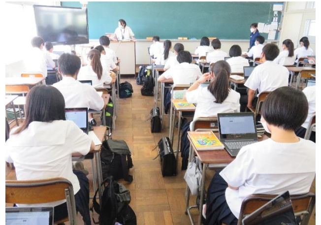
(「保健」の授業内でフォームの小テストを解答している様子)