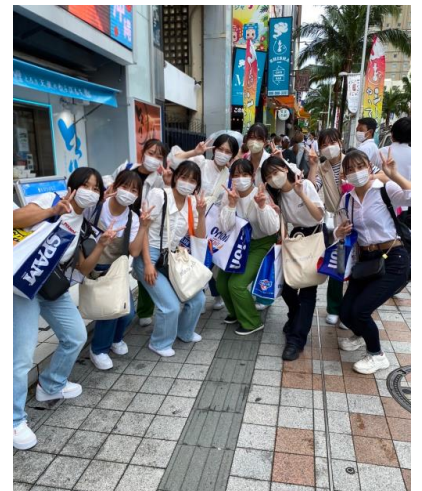
( 沖縄修学旅行の様子を配信しているクラスルーム )

また、11月21日(月)に大学入試に向けた進路LHRを視聴覚教室で行いました。志望校に対する配点の比率を調べたり、共通テストの目標得点をスプレッドシートで確認しました。修学旅行明けにも関わらず、気持ちを切り替えて真剣な表情で話を聞き、進路に関して考えていました。明確な目標をきちんと定め、目の前のできることを着実に積み重ねていこう、姫路高校76期生！