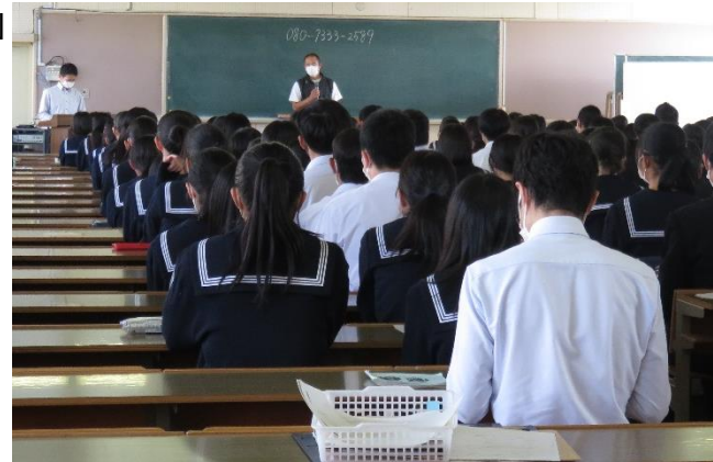
( 修学旅行結団式の様子 @視聴覚教室 )