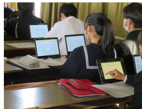
( 進路LHRの様子 @視聴覚教室 )