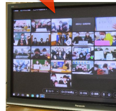
(合同生徒会の様子@ 飾磨高校)