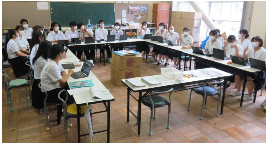
(生徒会室にて生徒たちが打ち合わせをしている様子)

学校生活において、2学期は行事やイベントがめじろおしです。それに伴い、本校76・77期(2・1年生)生徒会の生徒たちは、日々、行事の運営に意見を出しあっています。様々な行事に対して、少しでも生徒の皆が楽しめ、積極的に取り組めるようアンケートなど活用し、意見を集約しています。体育祭においては障害物競争の企画・運営、球技大会では種目選定の企画から運営までをタブレット端末を活用しています！会議ではGoogleドキュメントで共同編集しながら案をまとめつつ、進行することで企画案を練り上げています！楽しい学校行事を、自らの企画で作りあげていこう！