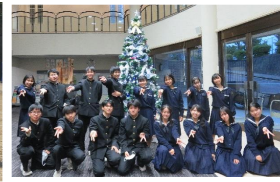
(11/22 クリスマスツリー点灯式の様子)