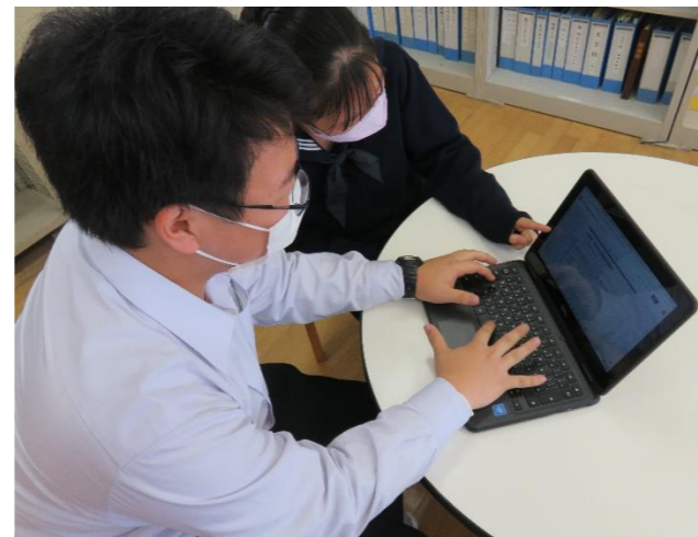
(球技大会に向けてフォームを作成している様子)