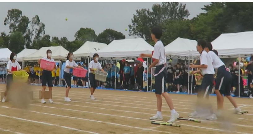
(雨の体育祭 生徒会企画の障害物競争の様子)