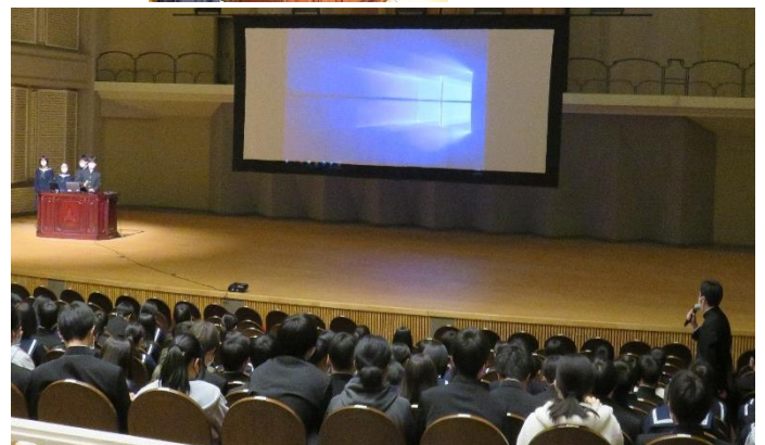
(学年での代表発表の様子 @パルナソスホール)