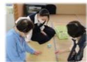
絵手紙講座の受講