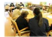
ケンフクサロン (デイサービス)の実施