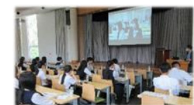
大学見学バスツアー