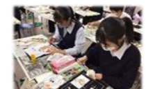
レクリエーション援助技術の修得