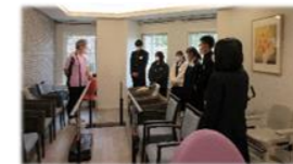
先進介護現場見学