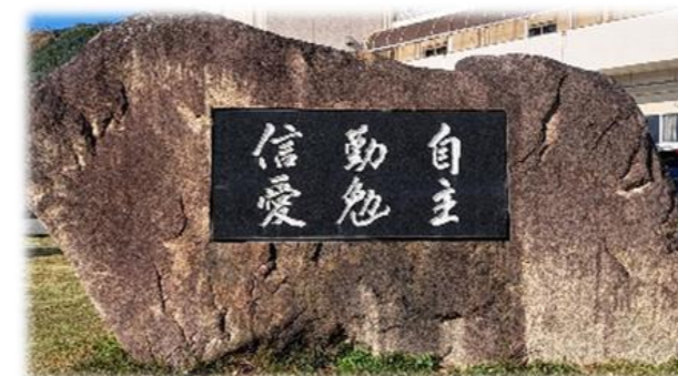
校訓『自主 勤勉 信愛』