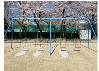
ブランコにも早く乗りたいね！