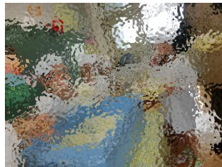
給食の準備も大仕事！