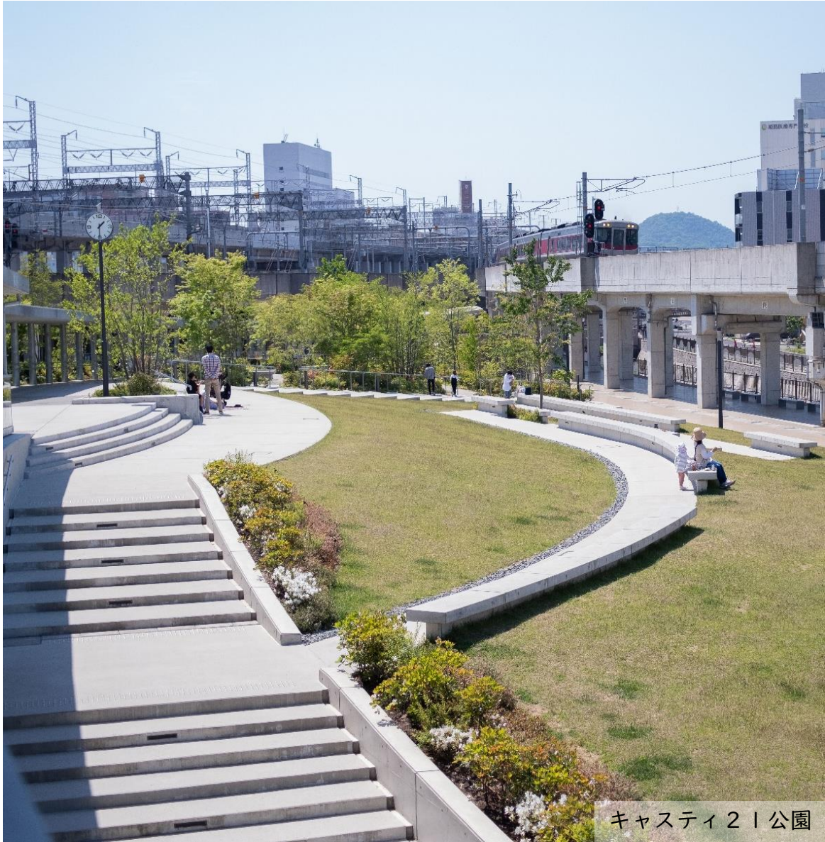
キャストイ2 | 公園