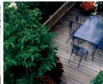
デッキテラスイメージ