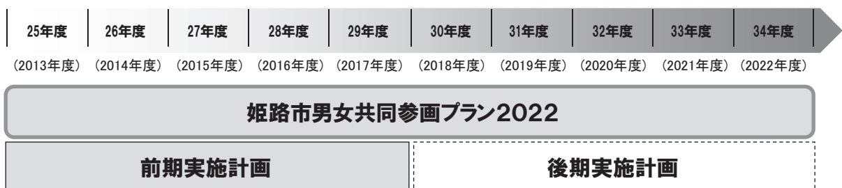
図表 12 計画期間

また、プランの計画的な推進を図るため、平成25年度から平成29年度までの5年間の前期実施計画を策定します。