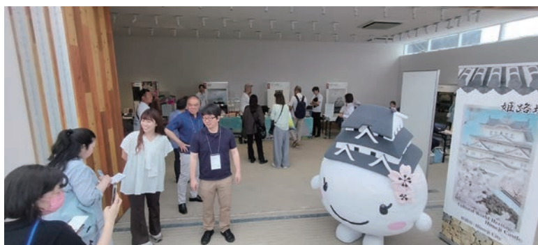
フィールドパビリオン出展時の様子

答 首都圏を中心にテレビ・雑誌に向けたメディアプロモーションの展開や宿泊施設・飲食店と連携した市内宿泊の促進、オンライン旅行会社で扱う宿泊施設との連携強化により、本市の魅力向上と宿泊需要拡大を目的とした観光プロモーションを実施している。