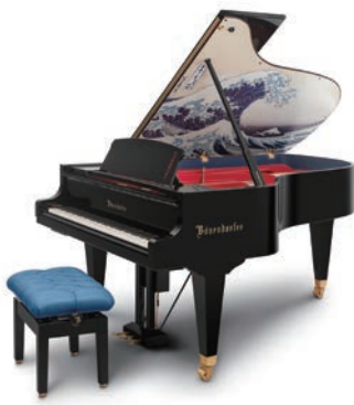
オーストリアパビリオンで展示されたブランドピアノ

答 アクリエひめじに設置予定で、活用方法は、自動演奏機能により来館者を迎える他、同施設の音楽イベントでの利用や施設利用者への貸し出しなど、市内外の来館者にさまざまな形で上質な音楽に触れる機会を提供していく。