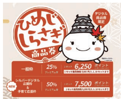
令和7年度ひめじしらすざぎ商品券の概要

答 アプリ起動時間の短縮について開発事業者と検討している。また、エラー発生がスマホの問題の場合には、コールセンターを設置し対応することを検討している。分かりやすく使い勝手の良いサービスを目指し、継続的に改善していく。