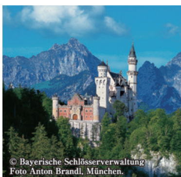
ノイシュバンシュタイン城

このため、各種広報媒体を活用した事業の事前周知に努める他、市民が国際交流事業に参画できる機会の創出に努めていく。