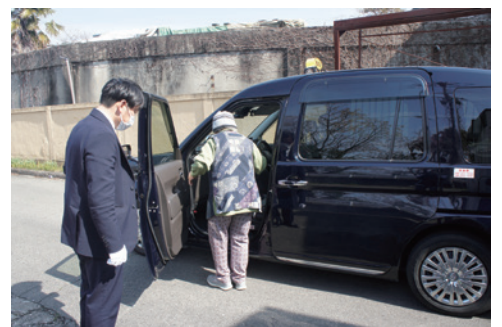
花田地区デマンド型乗り合いタクシー

答 8年度はバス事業者の車載器の更新に合わせ、他の公共交通機関からの乗り継ぎを円滑にするため、バス事業者が実施するキャッシュレス決済の環境整備を支援していく。このことで路線バスなど公共交通の利便性が向上すると考えている。