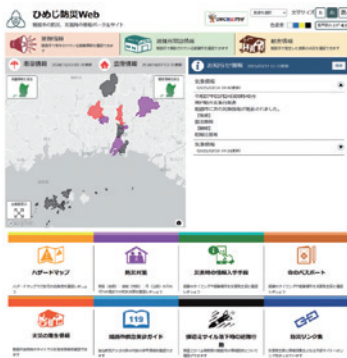
リニューアルしたひめじ防災Web

今後も引き続きデジタルツールの普及啓発を行い、早期の避難行動につながるDX化の推進を図っていく。