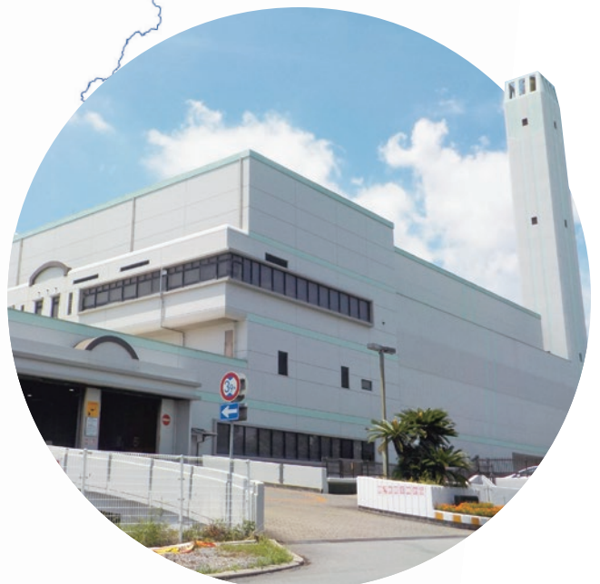
市川美化センター