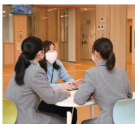
相談に訪れた学生たち

完全個室の相談室などもあり、プライバシーに配慮されているので、アットホームな雰囲気です。さまざまな世代が読める心と体に関する本も多数そろえてあり、相談事がなくても気軽に行ける場所でした