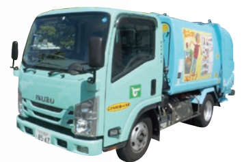
主なごみ処理施設の概要