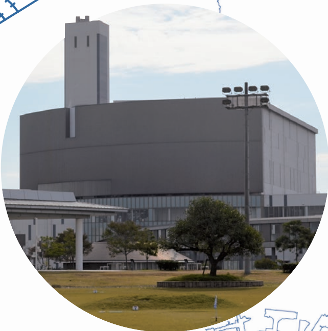
エコパークあぼし