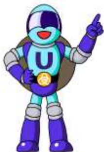
下水道普及キャラクター ホール☆マン U