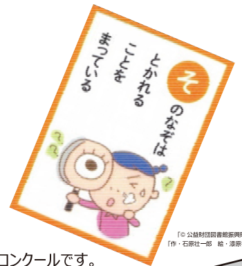
「公益財団法人図書館振興財団」 【作・石原社一郎 絵・澤原冬児】