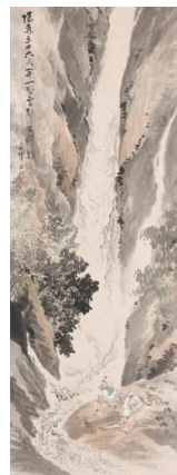
④ 《九龍古潭之図》 紙本墨画淡彩 制作年不詳 姫路市立美術館蔵