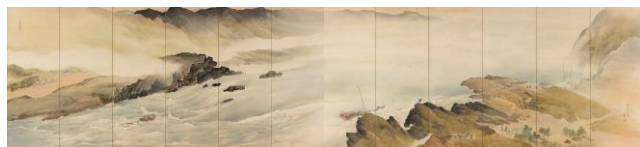
⑤ 《興隆灘図》 絹本着色 制作年不詳 西宮市大谷記念美術館