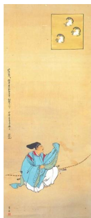
③ 《源三位頼政像》 絹本着色 1895~97（明治28~30）年 個人蔵