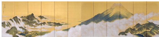
① 《富士五湖》 絹本着色（六曲一双屏風） 1936（昭和11）年 姫路市立美術館蔵