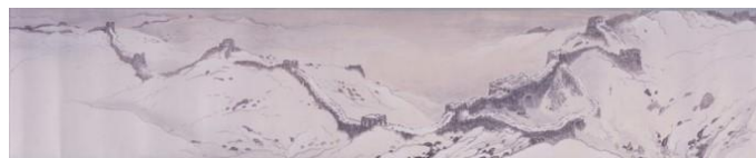
⑦ 《長城図巻》（部分） 紙本墨画淡彩 1919（大正8）年 姫路市立美術館蔵