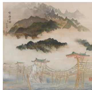
⑥ 《竿橋奇観》 絹本着色 1960（昭和35）年 個人蔵