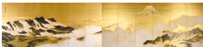
② 《富士五湖図》 絹本着色（六曲一双屏風） 1947（昭和22）年 姫路市立美術館蔵