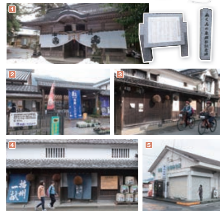
1 鹿田神社 / MAP C2 2 道の駅 揖保いちのみや / MAP C2 3 老松酒造 / MAP C3 4 山陽酒造 / MAP C3 5 神姫バス 山崎待合案内所 / MAP C3

揖保川上流の「一宮町」から、因幡街道の城下町「山崎町」へ。途中、揖保川のせせらぎをBGMに走る心地いいサイクリングコース。「山崎町」には美味しい水でつくる播州の地酒の酒蔵も点在。酒蔵や古民家を改装したカフェやレストランを巡るのもよし、「一宮町」にある道の駅で紫黒米を使った定食を堪能するのもよし。