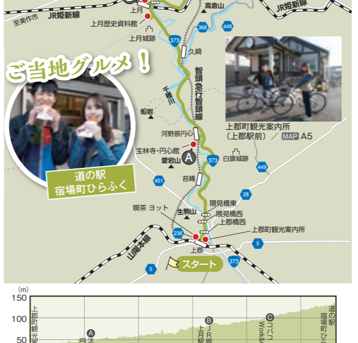
1 道の駅 宿場町ひらふく

距離 / 28km 獲得高度 / 41m 所要時間 / 2.5時間程度 コース詳細 道の駅 宿場町ひらふく