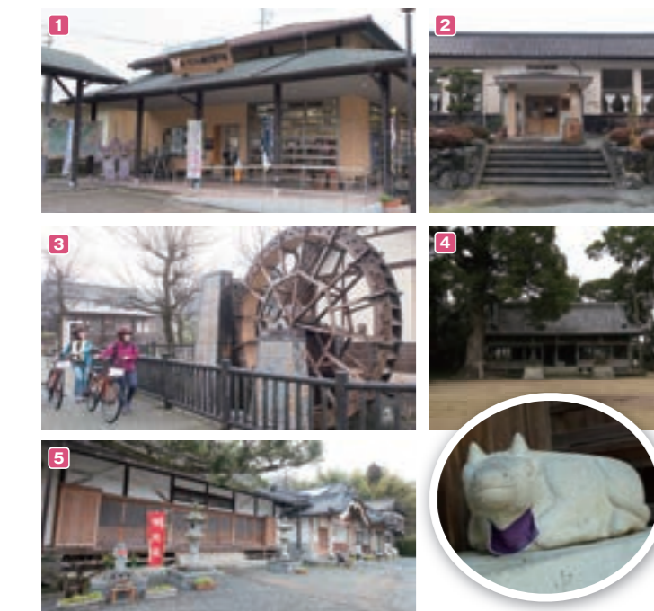
1 カミンの観光案内所(神河町観光協会) / MAP E3 2 昔ごはんとおやつの間 菜や / MAP E2 3 水車公園 こっこん亭 / MAP E3 4 小室天満神社 / MAP E3 5 善福寺 / MAP E2

ハート形の町、神河町を中心に、市川町・福岡町を通り、姫路市の港まで走るサイクリングコース。真っ赤な列車が走る播磨線「寺前駅」周辺を自慢の自転車を持参して、のんびりと走る。柚子畑や棚田、楡林など自然満喫後はお腹もへっこ。古民家や茅葺の建物を利用した飲食店も多いので、レトロな雰囲気なか、ゆったりと過ごせそう!