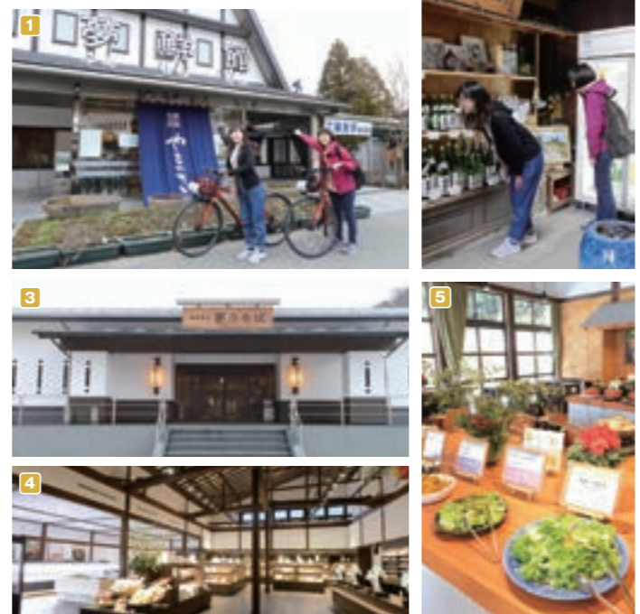
1 ヤマサ海鮮 夢前館 / MAP D5 2 麦飯酒造 / MAP D4 3 夢乃そば / MAP D5 4 レストラン「目録々」 / MAP D3

姫路城西、雪彦山から雪彦山ふもと、播磨灘まで流れる夢前川に沿って、田園風景を肌で感じるサイクリングコース。高低差も少ないので楽チン! 道中黄色がまぶしい★菜の花畑を横目でビューン! 雪彦山でロープウェイののりもよし、ヘルシーランチや美味しい珈琲を堪能したり、ゆったりと雪彦温泉でリフレッシュも!