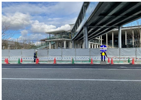
◎文化コンベンション前(のぼり)