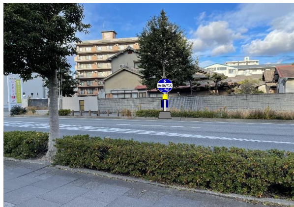
◎医療センター前(くだり)