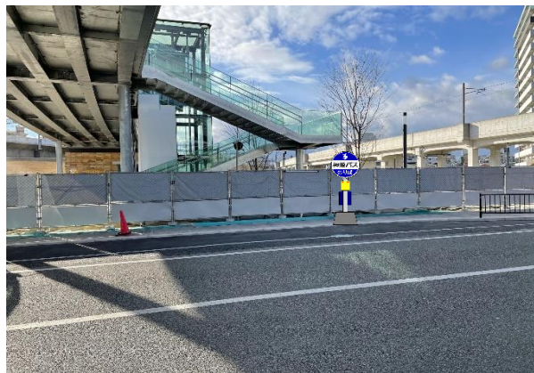
◎文化コンベンション前(くだり)