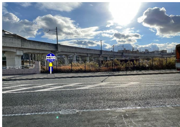
◎文化コンベンション北口(のぼり)