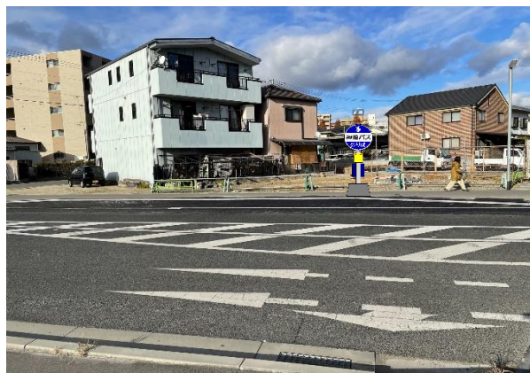
◎文化コンベンション北口(くだり)