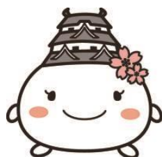
姫路市キャラクター しろまるひめ

コンプライアンスを周知徹底する為、ハラスメント研修、個人情報保護研修、社内で発生した事故やミス的事例を教材にした研修等を実施しています