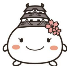
姫路市キャラクター しろまるひめ