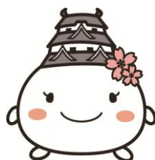
姫路市キャラクター しろまるひめ

ハラスメント撲滅を徹底するために日々従業員とのコミュニケーションをとり、風通しのよい相談しやすい環境づくりに取り組みます。