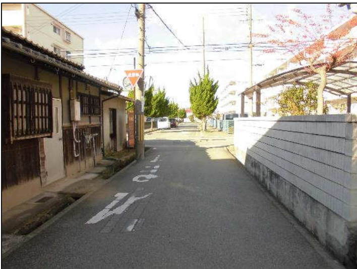
亀山線終点（東から西）事業前