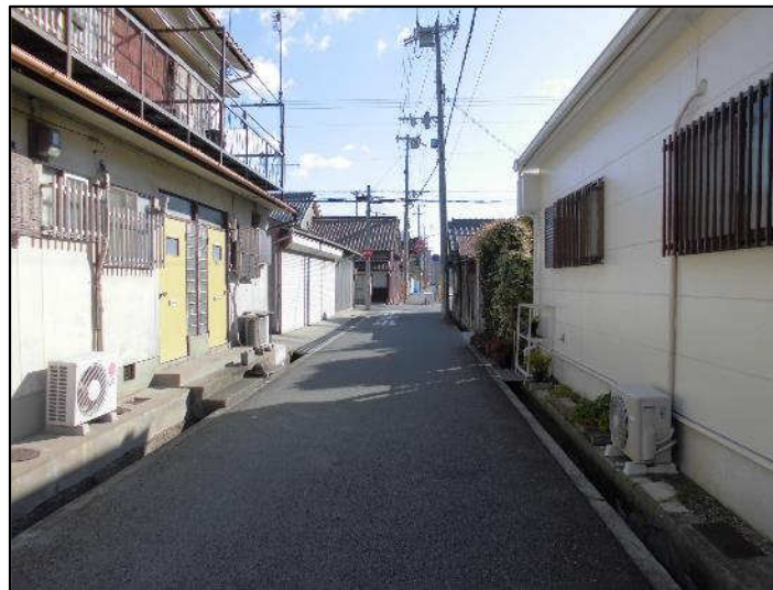
亀山線起点（西から東）事業前