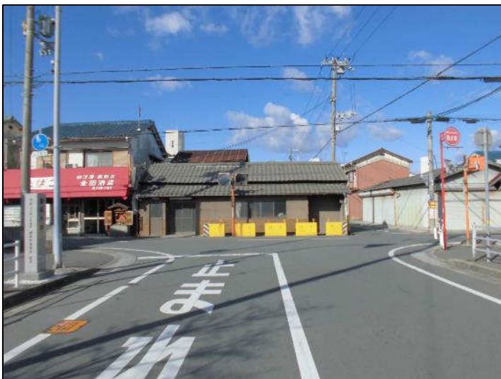
亀山線起点（東から西）事業前