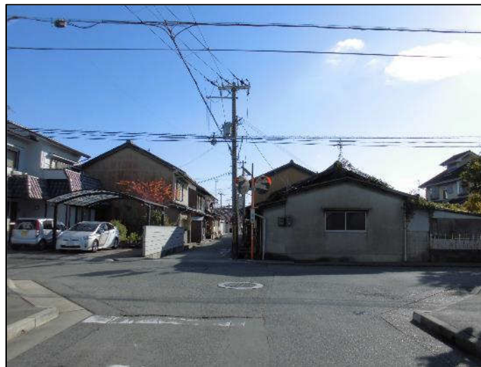
亀山線終点（西から東）事業前