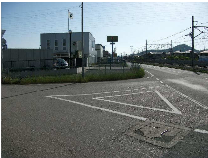
延末線 (東から西)整備前