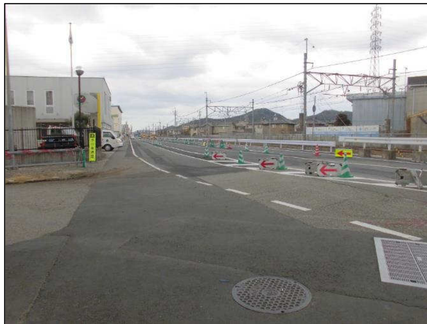
延末線 (東から西)整備中